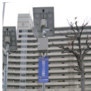
大阪市喜連東連合振興町会