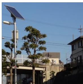
香芝旭ヶ丘ニュータウン