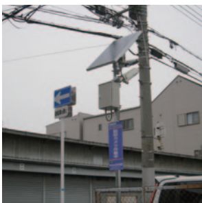
大阪市加美北連合町会