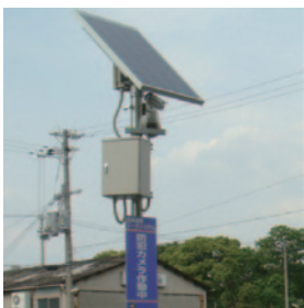
大阪市加美北連合町会