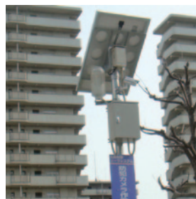
大阪市喜連東連合振興町会