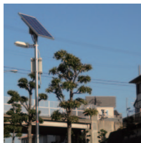
香芝旭ヶ丘ニュータウン