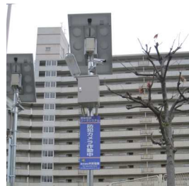
大阪市喜連東連合振興町会