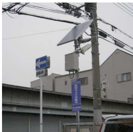
大阪市加美北連合町会