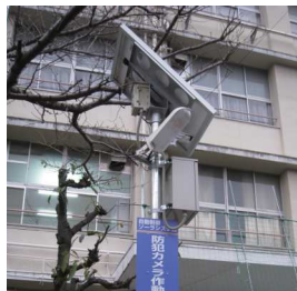
大阪市長吉六反連合町会