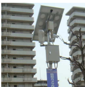
大阪市喜連東連合振興町会