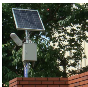
大阪市長吉六反連合町会