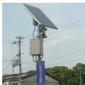
大阪市加美北連合町会